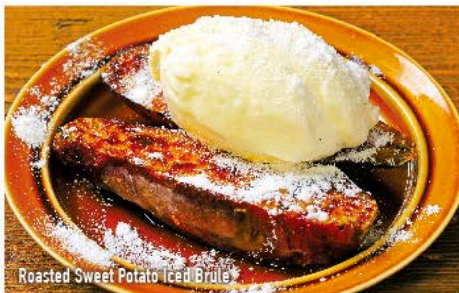
Roasted Sweet Potato Iced Brulee

濃厚とろける カマンベール・チーズケーキ 590 Melting Camembert Cheese Cake (税込 637)