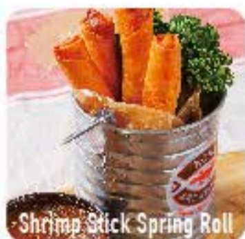
Shrimp Stick Spring Roll