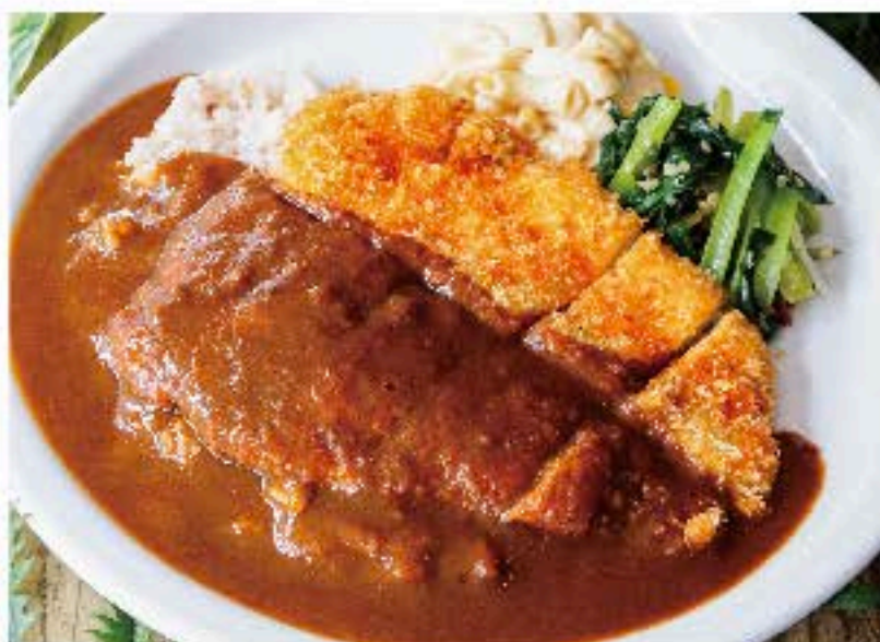
MEGAチキン・カツカレー 920 MEGA Chicken Cutlet Curry (税込 993) ボリューム満点ビックリサイズ! スープ付き