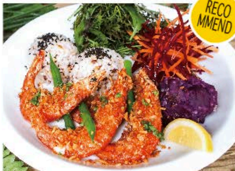
ガーリック・ソフトシェル・シュリンプ・プレート 1080 Garlic Soft Shell Shrimp Plate (税込 1166) 殻ごとジューシーに、ハワイの名物料理。 スープ付き