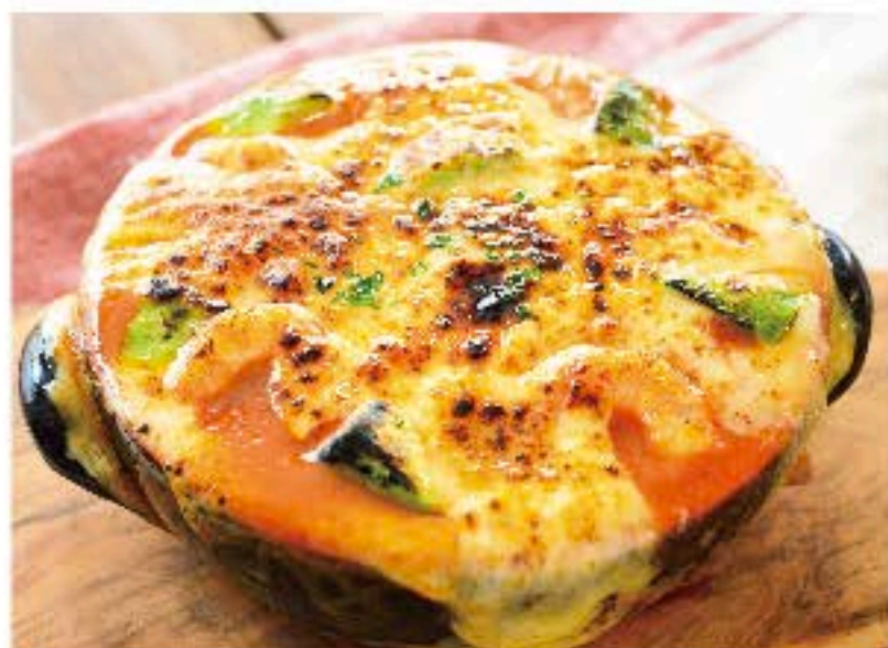
海老とアボカドのダイナマイト・ドリア 920 Dynamite Doria with Shrimp and Avocado (税込 993) ハワイ名物! 西京味噌とマヨネーズの濃厚海老ドリア。 スープ付き