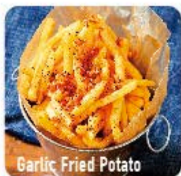
Garlic Fried Potato