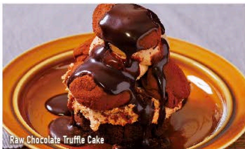
Raw Chocolate Truffle Cake

ハワイアンジェラート盛り合わせ 490 Hawaiian Gelato Assortment (税込 529)