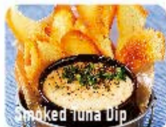
Smoked Tuna Dip