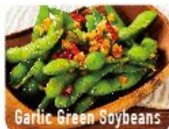
Garlic Green Soybeans