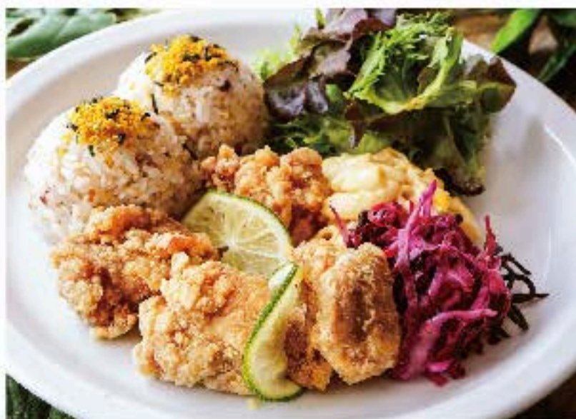
モチコ・フライドチキン・プレート 920 "MOCHIKO" Fried Chicken Plate (税込 993) ハワイの定番。モチ粉をまぶしたジューシーな唐揚げ。 スープ付き